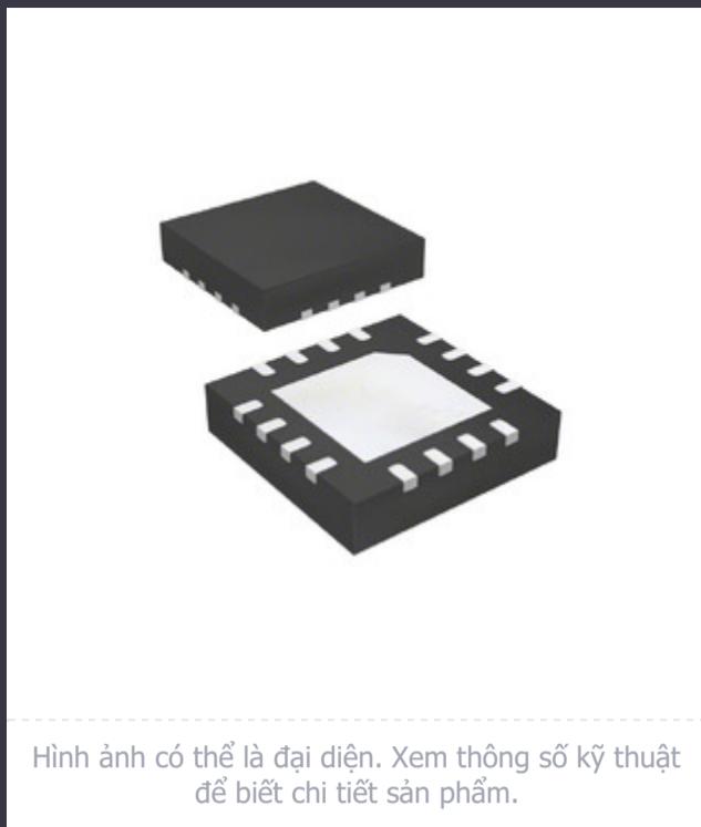
Hình ảnh có thể là đại diện. Xem thông số kỹ thuật để biết chi tiết sản phẩm.